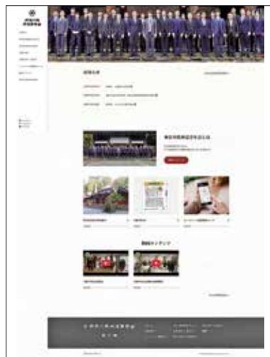
リニューアル後のトップページ

ため、この節目にホームページの大幅な刷新を行う事と致しました。近年求められているスマートフォン表示への対応を実装し、パソコンからの表示についても見やすい構成となるよう工夫致しました。また、動画掲載ページを常設化し、今後の展開についても幅広く対応できるように致しました。さらに、令和三年に立ち上げた「慰霊碑・忠魂碑調査事業」で会員が現地調査した県内全域の慰霊碑・忠魂碑の写真等の情報をホームページ上のGoogleマイマップに掲載し、ウェブ上で分かり易く閲覧出来るような仕様と致しました。