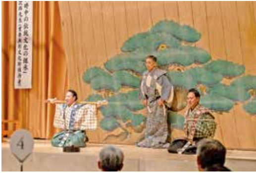
記念講演より狂言「棒縛」