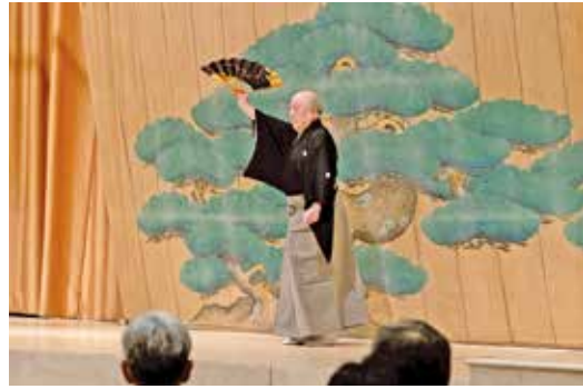
記念講演より狂言小舞「貝尽くし」

グムービーとして、創立六十五周年からの十年間をまとめた動画「六十五〜七十五周年の軌跡」を