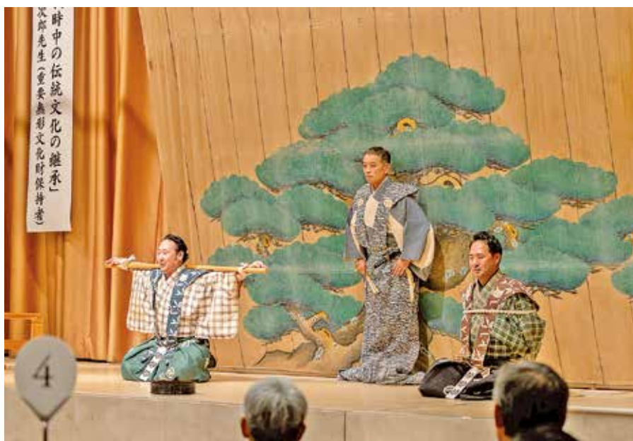
狂言『棒縛』：縛り付けられた太郎冠者・次郎冠者

非常にアマチュアっぽい山賊で、ちよつとした出来心でやっているのでなかなか成果も上がらない。それで喧嘩になって、ついに果たし合いをすることになるんですけど、その前に妻子に宛てた遺書を書いておこうということになります。その文面をあれこれ考えているうちに、奥さんや子どもがどれほど悲しむだろうと思ひ至り、結局仰直りして二人で手をつないで山を下りてくるという狂言です。