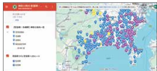
新設された慰霊碑・忠魂碑マップページ