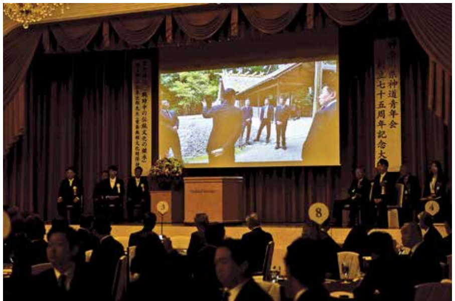
記念大会当日 上映の様子