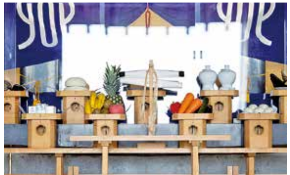
御霊前にお供えした神饌と幣帛