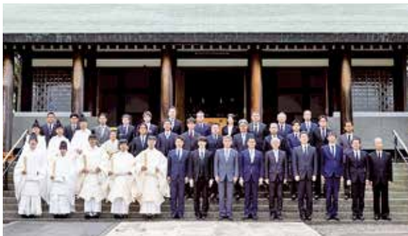
祭典奉修後の記念撮影