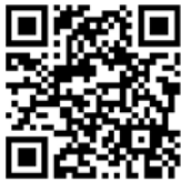
記念大会上映動画 ①記念事業経過報告

ぜひ、当会の歩みと本記念事業の活動を多くの方にご覧いただければ幸いです。動画は下記QRコードからご覧いただけますので、ぜひご利用ください。