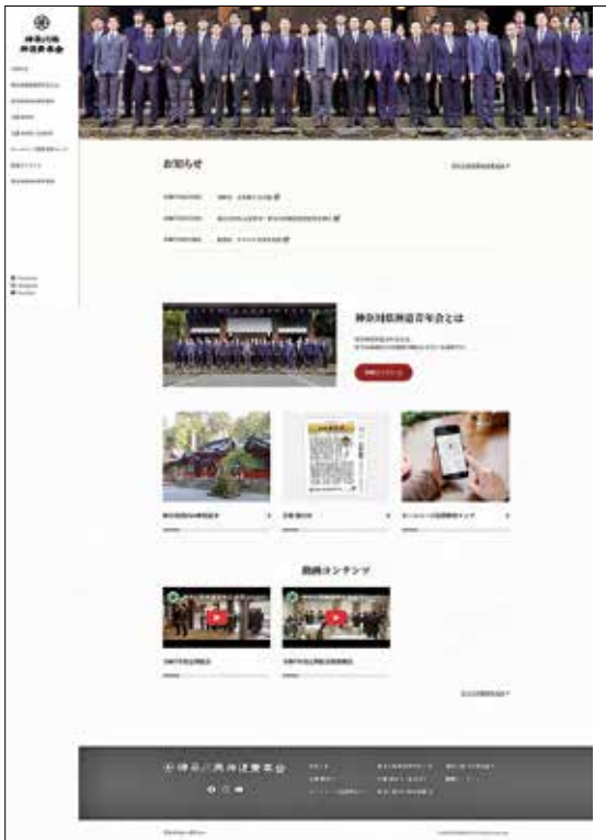
リニューアル後のホームページ

管理面においても大幅なコストダウンと、更新作業の効率化を実現しました。新システムにはWordPressを導入し、県内神社紹介など一部ページの更新をウェブ上で簡潔に行えるようになったため、担当部局の負担が軽減されており、また、運用面ではサーバー容量の増加、表示速度向上など、多岐にわたって強化されており、一方で専門的な対応が必要な場合には、従来通り業者に都度依頼できる体制を維持し、安定した情報発信を行えるよう備えております。