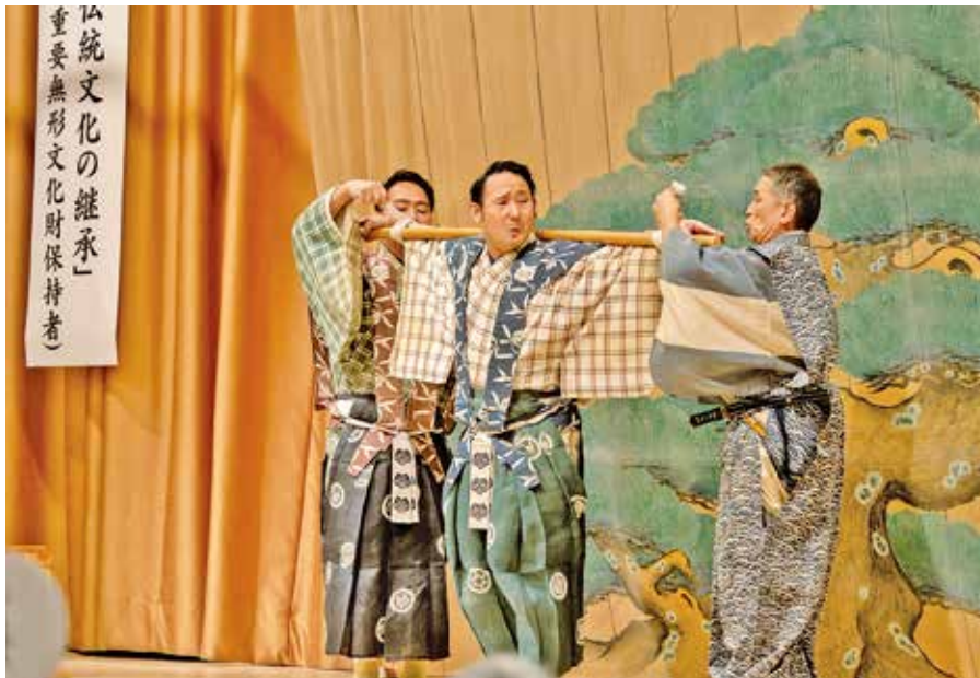
狂言「棒縛」：主人と太郎冠者により棒に縛り付けられる次郎冠者

それからもう一つの美意識としては「礼節」。チケットを買ってくださるからということではなくて、舞台上にいる人、それをご覧になる人、互いの尊び合い方なんです。今、私は黒い紋付を着ております。これは着飾っているんじゃないんです。黒紋付は着物の中でいちばんの礼服です。それを着て皆様にお目に掛かるということです。そして紋付には家紋が付