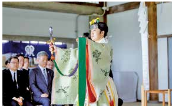
神楽「浦安の舞」奉奏