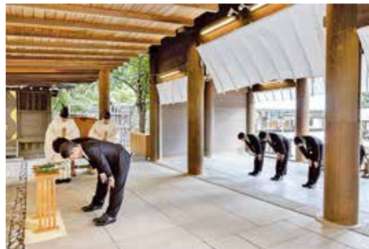
当日朝の正式参拝

協議会並びに神青協一都七県協議会、全国単位会の同志の皆様を含む、総勢二百名の御出席を頂き、神奈川県神道青年会創立七十五周