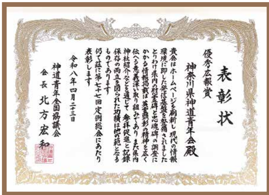
神道青年全国協議会 令和7年定例表彰「優秀広報賞」受賞 神奈川県神道青年会 ホームページリニューアル